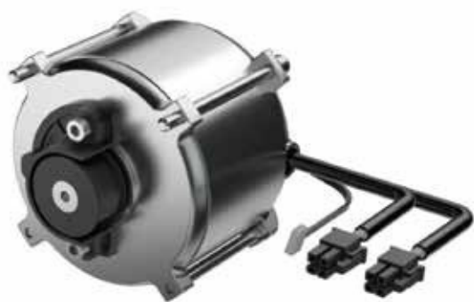
Motor Brushless con dos bobinados completamente independientes, para SL5 Emergency.