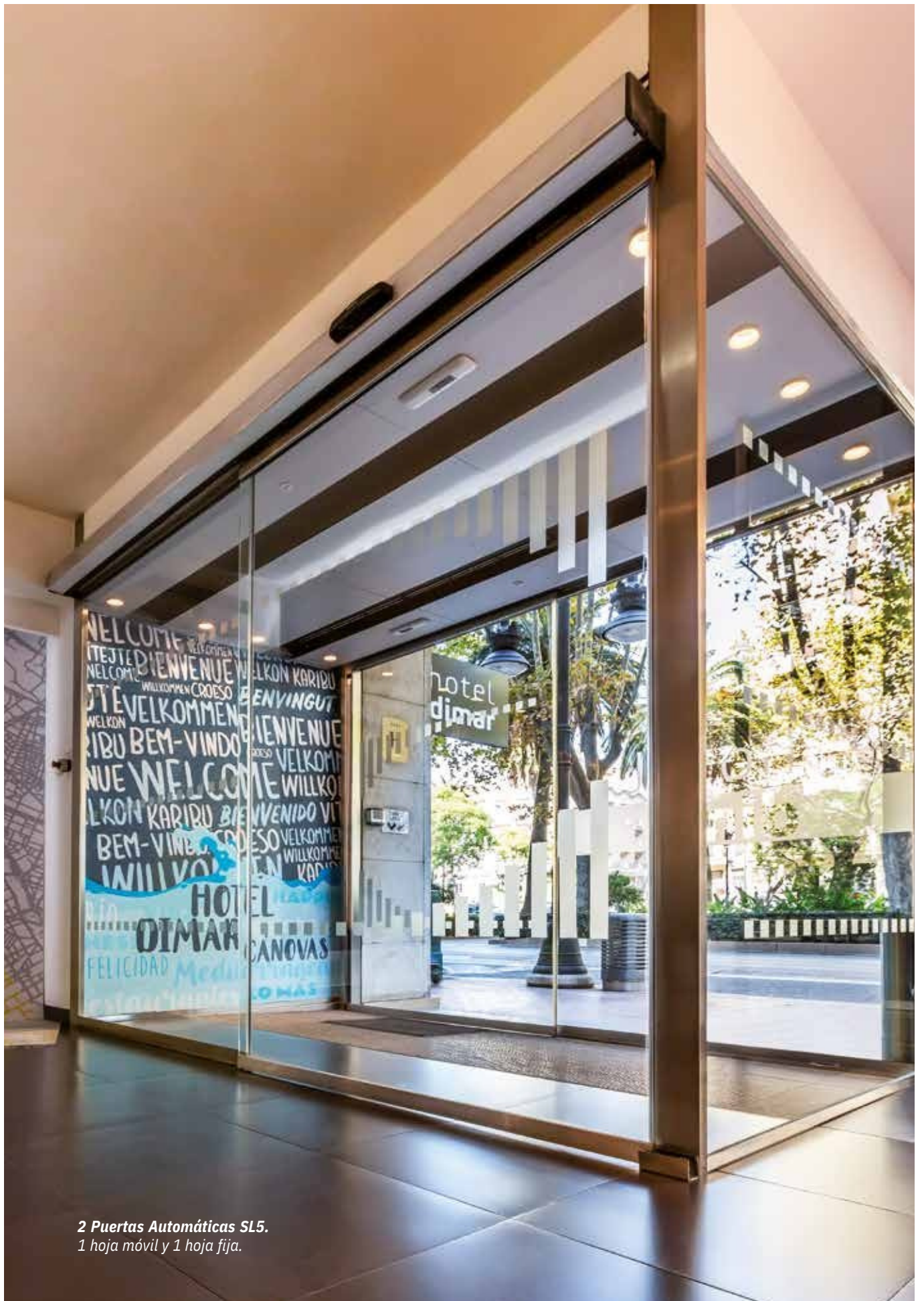
2 Puertas Automáticas SL5. 1 hoja móvil y 1 hoja fija.