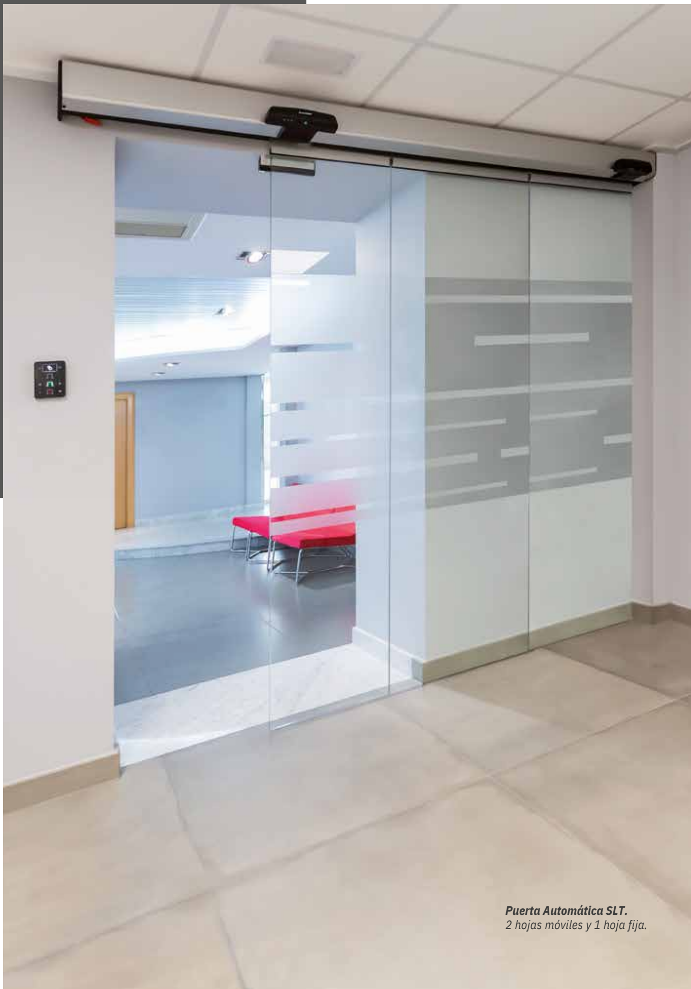
Puerta Automática SLT. 2 hojas móviles y 1 hoja fija.