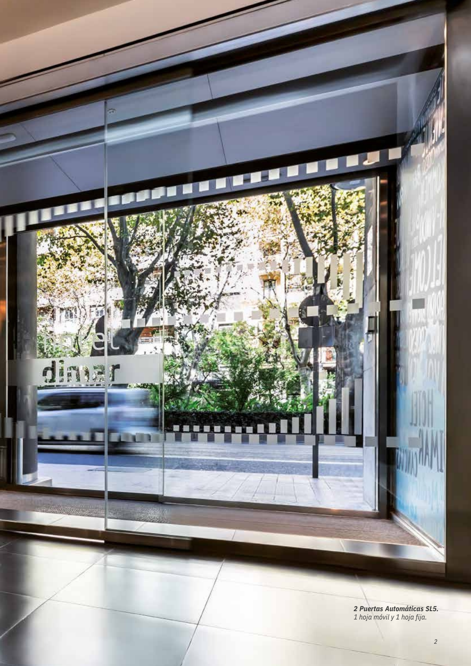
2 Puertas Automáticas SL5. 1 hoja móvil y 1 hoja fija.