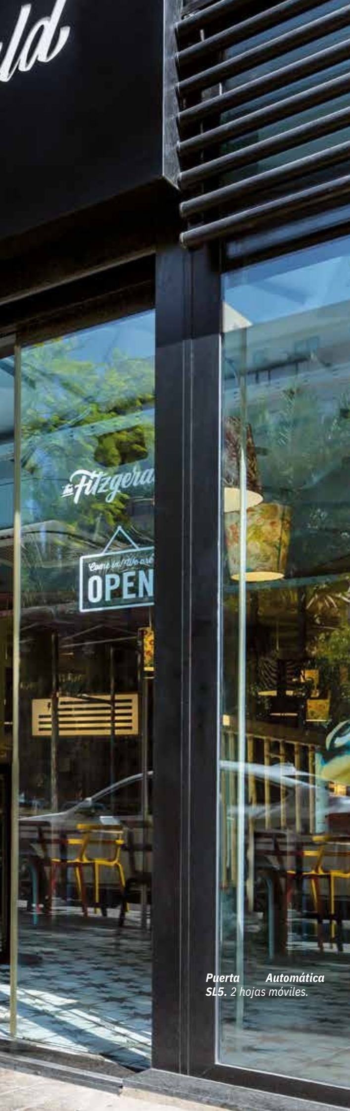
Puerta Automática SL5. 2 hojas móviles.